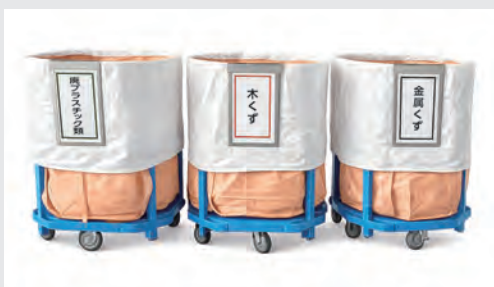
フレコンフレーム (ユニック車)