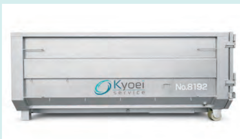
8m 3 コンテナ (4t車)